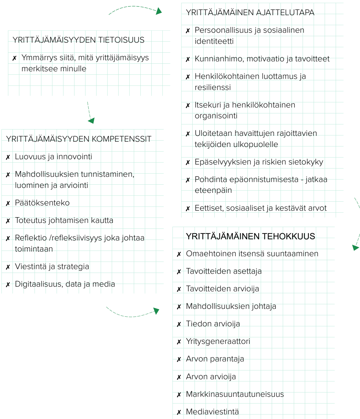
Kuva 1 (mukautettu QAA:sta, 2018)

Oppilaiden oppiminen ei välttämättä ole lineaarista; heillä ovat todennäköisesti erilaiset lähtökohdat ja tulevaisuuden näkymät; he voivat olla eri vaiheissa; tai he voivat osallistua samanaikaisesti erilaisiin oppimiskokemuksiin.