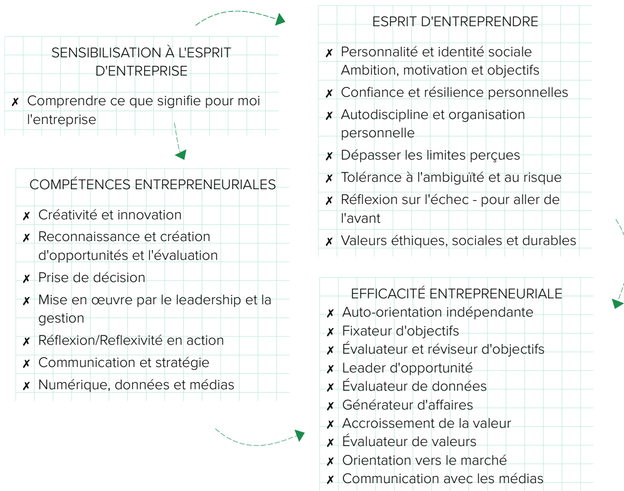
Figure 1 (adaptée de QAA, 2018)

L'apprentissage des élèves n'est pas forcément linéaire ; leurs parcours sont susceptibles d'avoir différents points de départ et de transition vers l'avenir ; ils peuvent passer par différentes étapes de manière itérative, ou s'engager simultanément dans différentes expériences d'apprentissage.